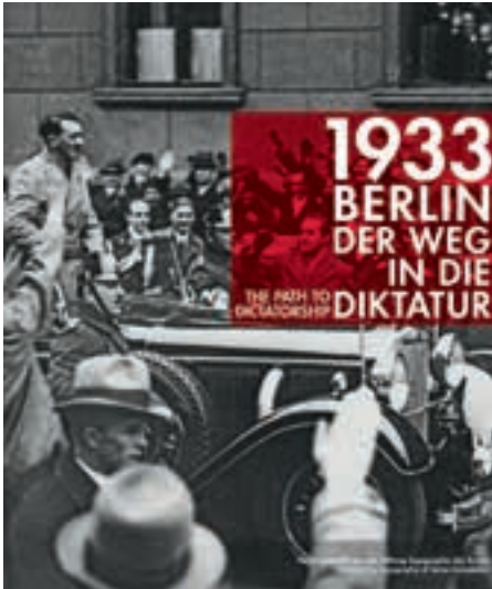
Begleitband zur Ausstellung »1933 Berlin. Der Weg in die Diktatur«, die 2013 im Dokumentationszentrum Topographie des Terrors zu sehen war.

Rücktritt des Reichskanzlers Heinrich Brüning im Mai 1932 will dessen Nachfolger Franz von Papen die republikanische Verfassung beseitigen. Am 20. Juli 1932 setzt von Papen die demokratische Regierung Preußens ab. Dieser ›Preußenschlag‹ besiegelt das Schicksal der Weimarer Republik. Die demokratischen Kräfte sind zu schwach zum Widerstand. Systematisch setzen die Nationalsozialisten Gewalt und Terror als politische Instrumente ein. Straßenkämpfe und Saalschlachten bestimmen jetzt die politische Auseinandersetzung. Bei den Reichstagswahlen Ende Juli 1932 erreicht die NSDAP 37,2 Prozent der Stimmen und 230 Mandate. Eine regierungsfähige Mehrheit im Reichstag kommt nicht zustande.« 2