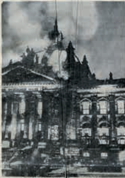
Das brennende Reichstagsgebäude

Kampfblatt der national-sozialistischen Bewegung Deutschlands