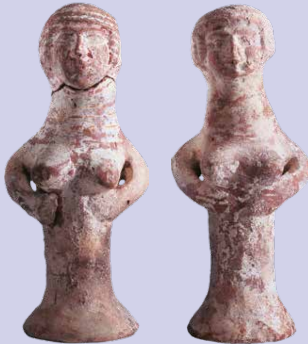
Figurinen aus Judäa, 750–620 v. d. Z. Bibel+Orient Museum Freiburg, VFig 1998.4, VFig 1998.5, VFig 1999.6, Sammlungen BIBEL+ORIENT der Universität Freiburg, Schweiz. Vermutlich handelt es sich bei den Figurinen um Miniaturkopien der Aschera, die laut dem biblischen Bericht (2 Kön 23) zeitweise als weibliche Gefährtin Gottes im Jerusalemer Tempel verehrt wurde.